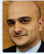
Ιωάννης Ξιφάρης Γενικός Γραμματέας Υπουργείο Μεταφορών & Υποδομών