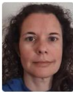
Ντία Χωραφά Οργάνωση Μπορούμε/ Συντονιστής Συμμαχίας για τη Μείωση της Σπατάλης Τροφίμων*