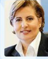
Χριστίνα Καλογήρου Γενική Γραμματέας Αγροτικής Ανάπτυξης και Τροφίμων Υπουργείο Αγροτικής Ανάπτυξης